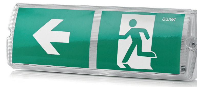
HLM02 LED с наклейкой